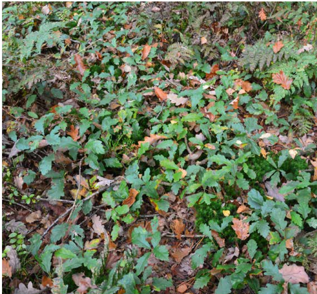
Eikenkiemplanten in eikenbos, in afwachting van voldoende opening van het kronendak.